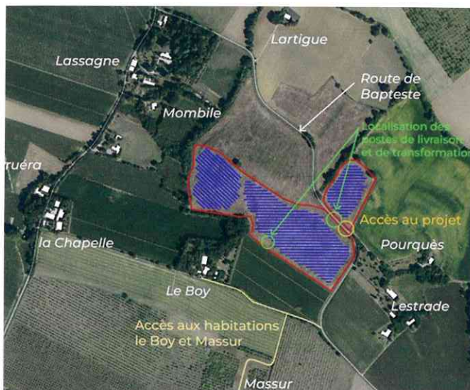
2. Plan de situation du site de projet.