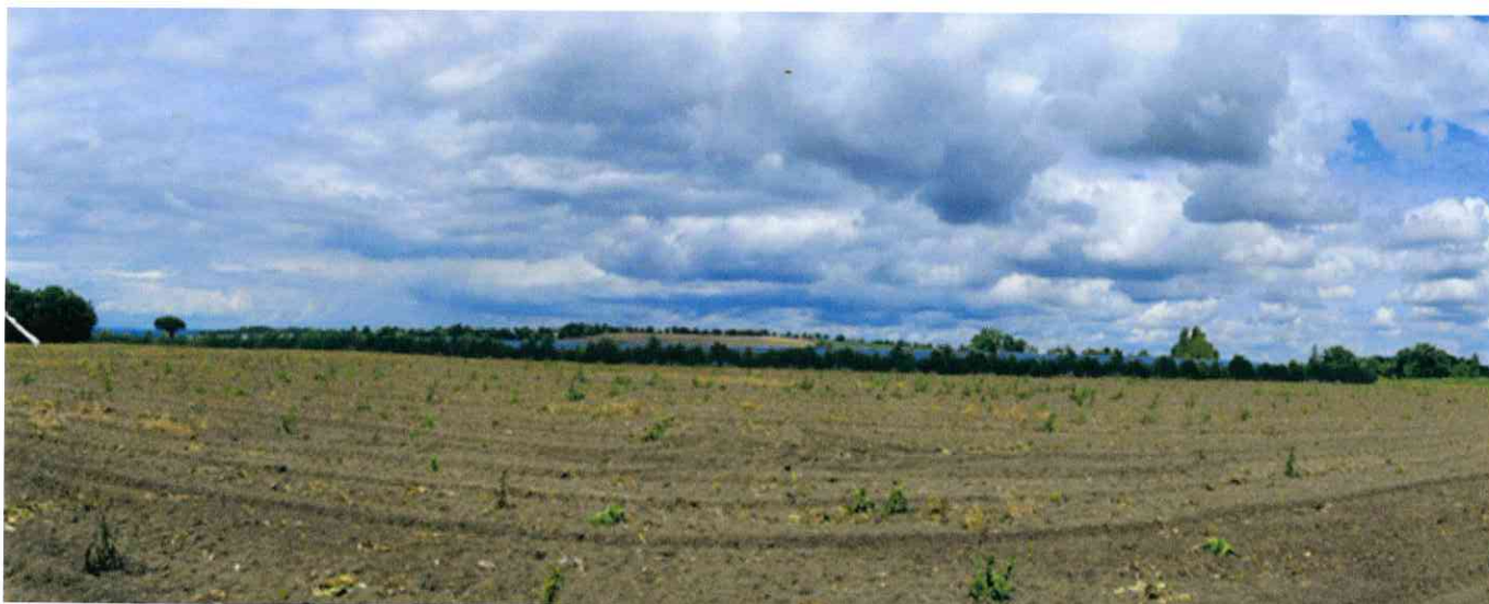
1. Photomontage depuis le croisement entre l'accès de Massur et celui du Boy - avec traitement paysager.

Aedes Énergies et ses équipes restent à disposition des Moncrabelais et des Moncrabelaises souhaitant s'informer sur le projet. Des permanences seront prévues lors de l'enquête publique afin de répondre à leurs questions. ●