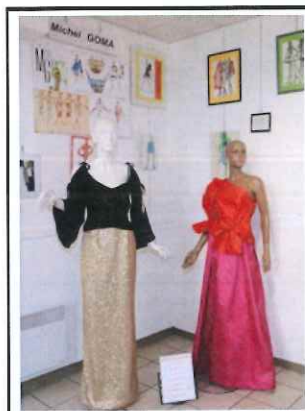
Deux robes créées en 2021 par Michel en cadeau au Musée

La levée des restrictions sanitaires va permettre l'ouverture du musée à Pâques, comme chaque année. Il sera donc ouvert à partir du 17 Avril le samedi et dimanche de 16h à 18h, puis tous les jours à partir de juillet, de 16h à 18h. En dehors de ces horaires, les visites sont toujours possibles, en se renseignant au 06 47 01 10 73