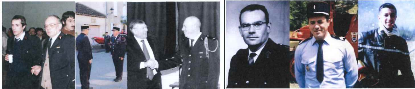
Pompiers de père en fils